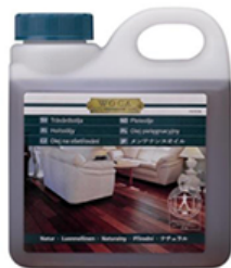
◆WOCAメンテナンス オイルナチュラル