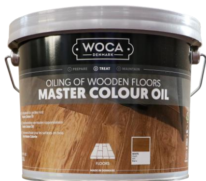
WOCAマスターカラーオイル ホワイト (旧WOCAマスターオイル ホワイト)