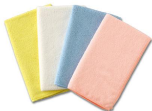
マイクロファイバークロス