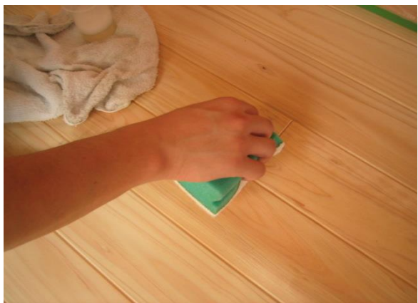
洗浄(研磨剤なしのスポンジ)