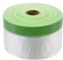
マスキングテープ