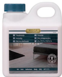
◆WOCAメンテナンス オイルホワイト