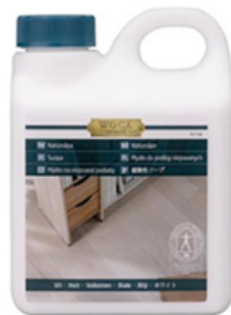
◆WOCAナチュラル ソープホワイト