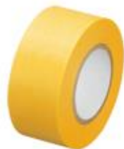
マスキングテープ