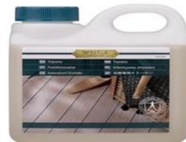
WOCAウッドクリーナー