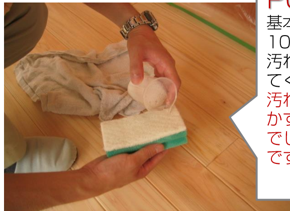
ウッドクリーナー希釈液とスポンジ