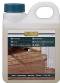
◆WOCAナチュラル ソープナチュラル