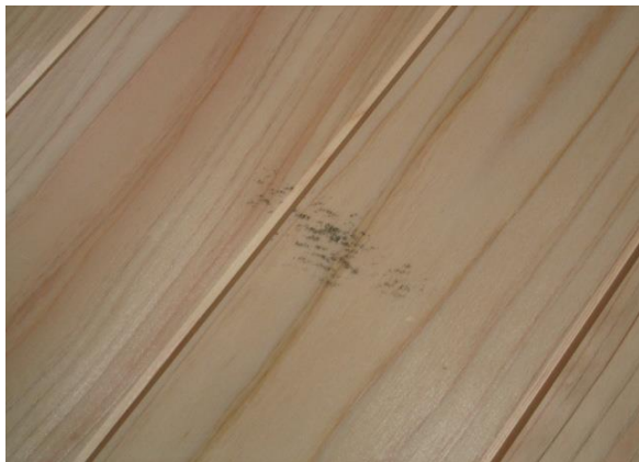
接着剤による汚れ状況