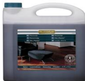
WOCAマスターオイル ナチュラル